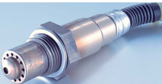
Sonda lambda Bosch